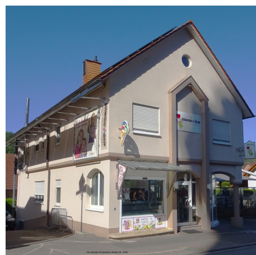
Das Haus 2024, O.Weber