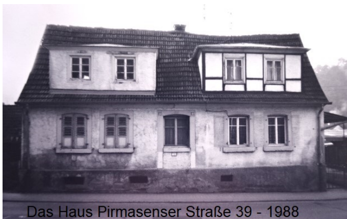
Das Haus 1988, O.Weber