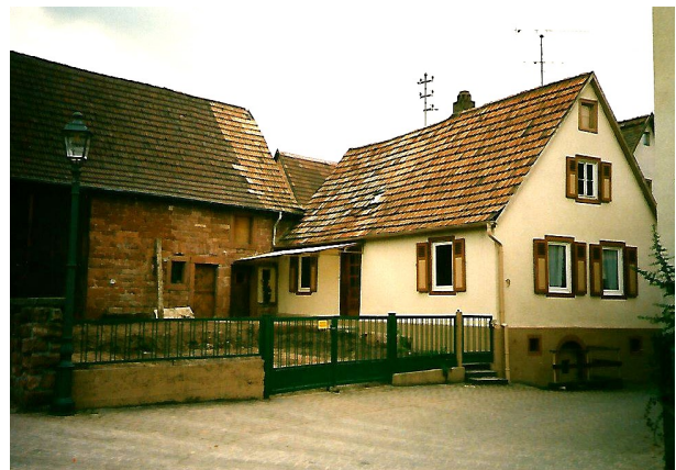
Haus Schäfergasse 9, heute Turnverein Dahn 1990, O.Weber (rechte Abb.)