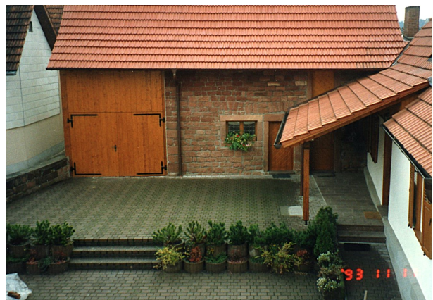
Das renovierte Haus als Vereinshaus des Turnvereins Dahn 1910 e.V. 2024, O.Weber