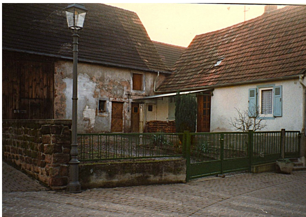
Schäfergasse 9, ehemals Jakob Levy 1987, O.Weber (linke Abb.)